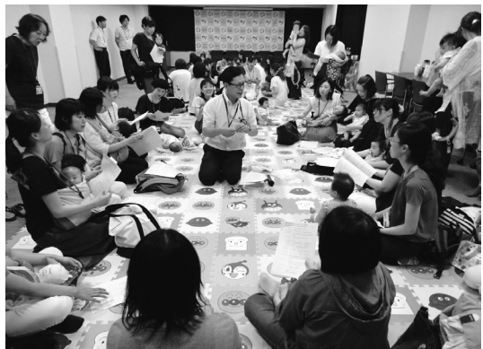
写真1 ハッピーママ交流会

WLB支援センターでは、看護部とも協力して主に育児休業中の職員を対象に（休業前、復帰後の職員も参加可能）「ハッピーママ交流会」を年1回開催している（写真1）。この交流会は、育児休業中に職場や世間と接する機会がなく