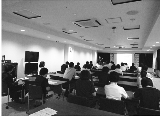
写真2 ワークライフバランス講演会

また、院内の様々な情報を掲載した「ワークライフ手帳」を毎年発行しているほか、HPの随時更新、院内外の情報を掲載した「Tomorrow通信」を月1回以上発行して情報の周知、提供にも取り組んでいる。