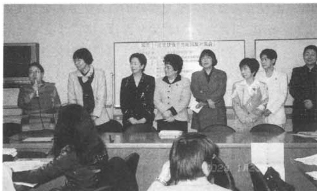
野党国会議員からの発言