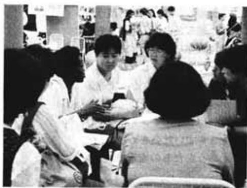
NGOフォーラムに参加して