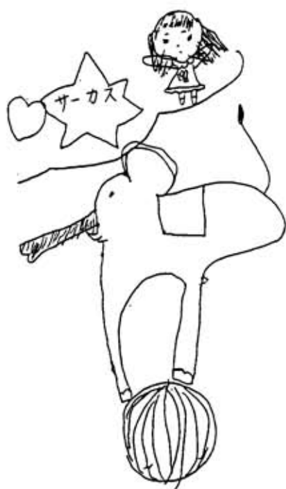
横浜の会員さんの長女(5歳)が送ってくれたカットです(P4、6、7も)

全然。離婚してやる、子どももやる。だからありがたく思えという感じでした。金の切れ目が縁の切れ目っていうから、まあいいかと。