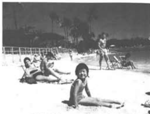
さんの娘。ハワイのワイキキビーチにて

いえ、まだはつきりしないんですが、大学の先生からは、修士課程へ進まないかと言われているんです。だから進みたい気もあるけど、働かなきゃならないし。何しろ離婚して子どももいる身ですから。