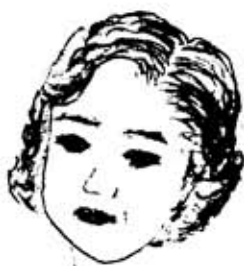
です どうぞよろしく……

だが、食の細い子が、与えられた分量の給食を時間内に食べきれず、みんなが掃除をするほりだらけの教室で、ひとり食べさせられていた様など、教育の現場を知れば知るほど、学校教育に対する疑問は深まるばかりであった。学習面のみならず、子どもの個