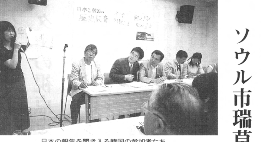
日本の報告を聞き入る韓国の参加者たち

日中韓3国共通歴史教育書出版記念シンポジウムから。ドイツの教科書は、戦争責任をどう扱うか、歴史認識をどう伝えるか、といった点で、日本と異なる点が多い。ドイツの教科書は、戦争責任をどう扱うか、歴史認識をどう伝えるか、といった点で、日本と異なる点が多い。