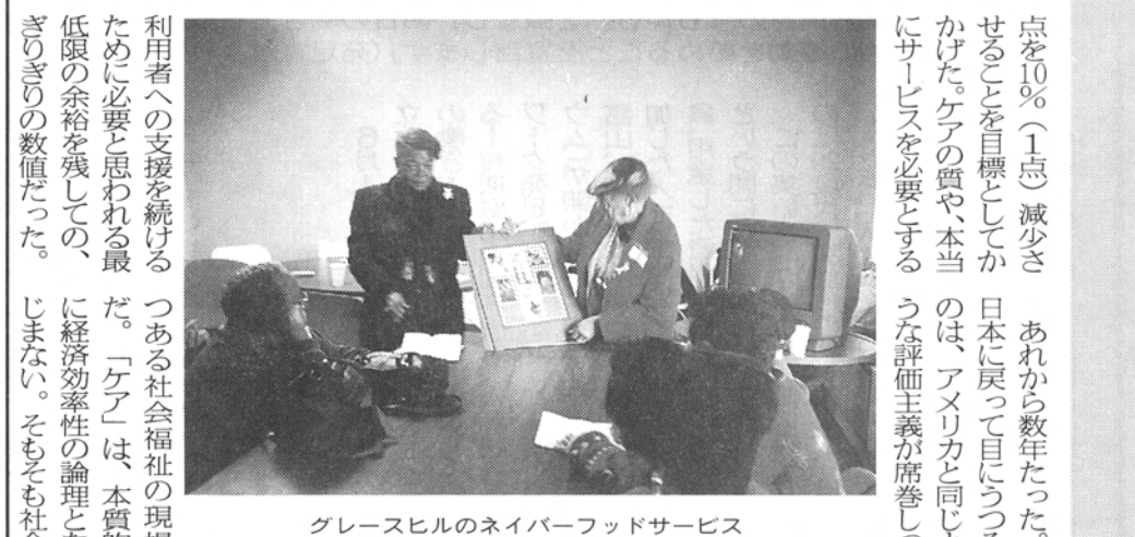
グレースヒルのネイバーフッドサービス

資金援助申請に苦勞を覚える人々。評価主義になじまぬケアを提供している人々。資金援助申請に苦勞を覚える人々。評価主義になじまぬケアを提供している人々。