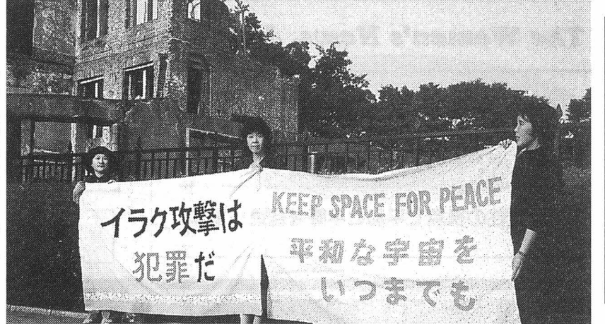
「イラク攻撃は許さないと訴えた」

10月30日(水) ◆「有事法制」と「防衛力増強」をめぐって 10月31日(木) ◆「有事法制」と「防衛力増強」をめぐって 11月1日(金) ◆「有事法制」と「防衛力増強」をめぐって 11月2日(土) ◆「有事法制」と「防衛力増強」をめぐって 11月3日(日) ◆「有事法制」と「防衛力増強」をめぐって