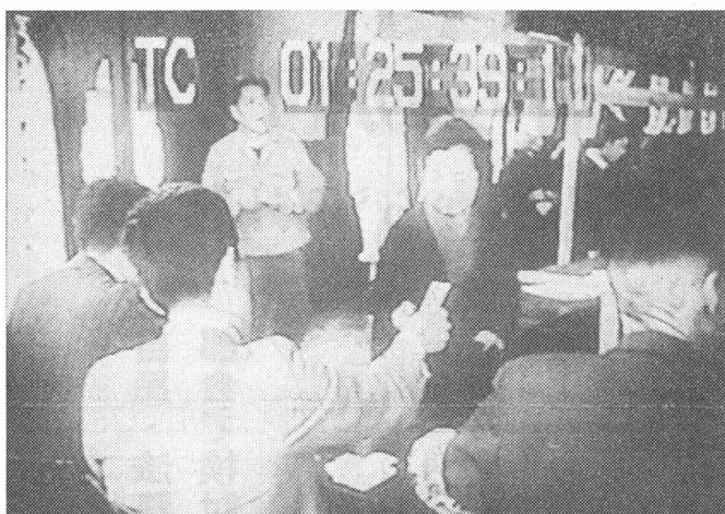
初の投票「毎日ニューズ映画」より