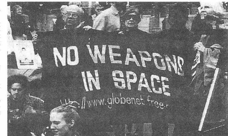
ビデオの一場面から

制作の日本語版が完成、発売されている。ラムスフェルド国防長官は「ABM条約(対弾道ミサイル制限条約)は古くさい」と言い放ち、宇宙軍競争を推進する。アメリカの宇宙軍競争に警鐘をならすビデオ『帰ってきたスターウォーズ』が、30キロ離れた農村地帯の2万5000人が対象。アフガニスタン