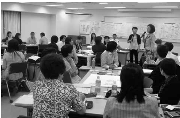
コース別ワークショップ (女性関連施設管理職コースより)

に見ることができ、今後のより良い活動に役立てられると感じた。いただいた情報を持ち帰り、組織内で共有し他組織との協働のきっかけにしたい」(団体リーダー)などの声があった。