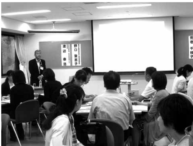
コース別ワークショップ (地方公共団体職員コースより)