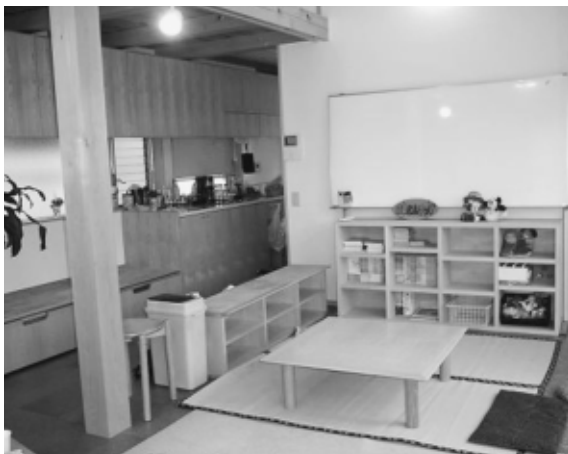
事務所内フリースペース

基本的に0歳から未就園児を対象としているが、前述したように助産院横のため0歳児が圧倒的に多く、ベビー布団を敷いて赤ちゃんを寝かせ、その横でお母さんもごろ寝というような姿も多く見られる。