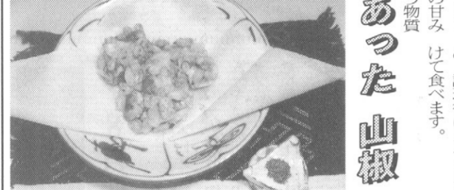
そら豆の甘味と小柱の磯の香りを花椒で

山椒は、日本が原産の食材で、料理のアクセントとして使われています。山椒は、日本が原産の食材で、料理のアクセントとして使われています。