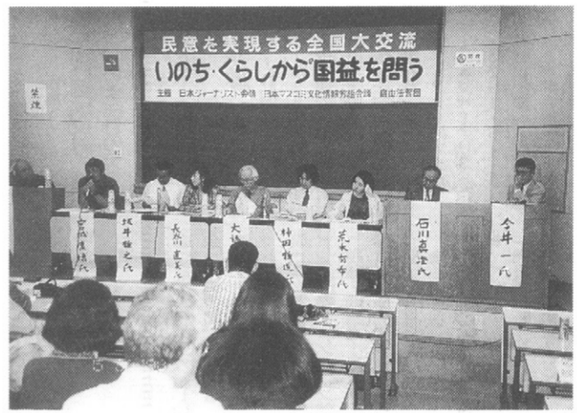
住民投票の現場からの報告をもとに「民意」を考えた