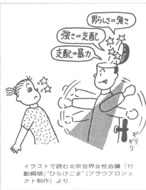
イラストを贈る北京世界女性会議「行動綱領」の「ひらけごま」(フラウプロジェクト制作)より