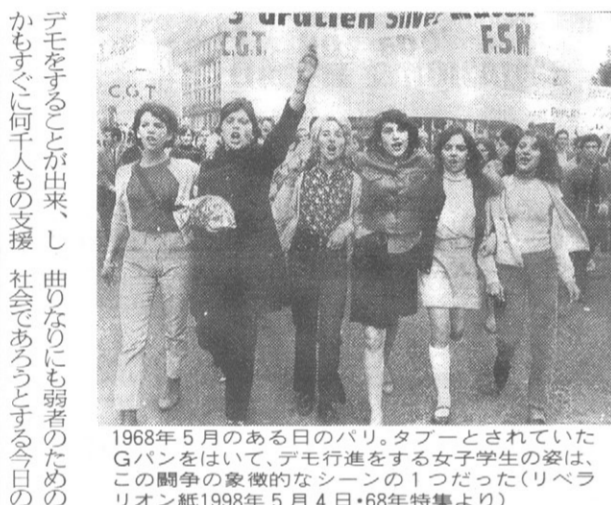
1968年5月のある日のパリ。タブーとされていたGパンを穿いて、デモ行進をする女子学生の姿は、この闘争の象徴的なシーンの一つだった...