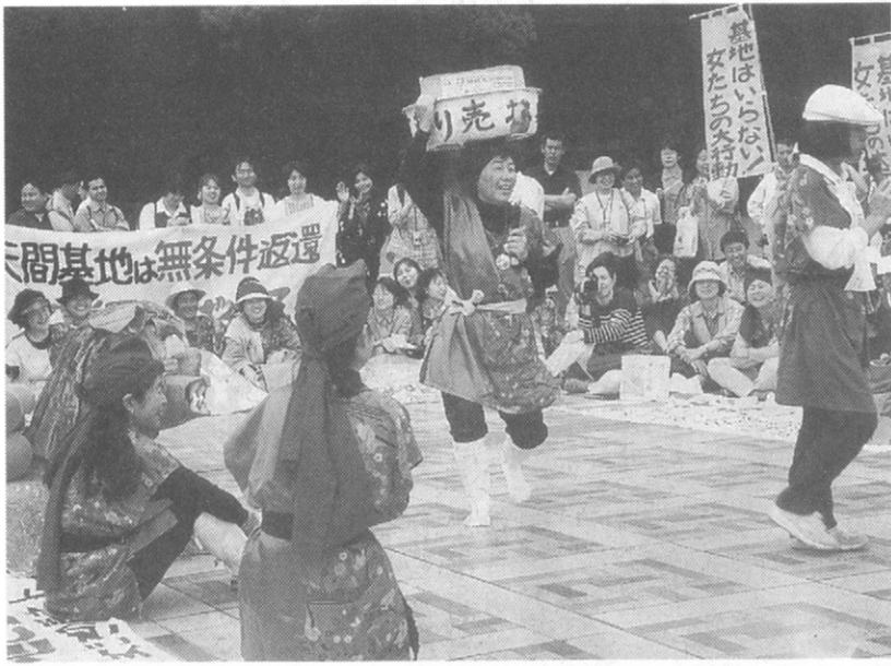
原宿駅付近で元気に元気に「基地の売り捨て」パフォーマンス

沖縄の女たちのアピール 東京の盛り場にこだまする 「普天間基地はいらない。今なら振興策つきで大安売りだよ!」沖縄の女性たち百二十四人の声が東京の盛り場にこだました。「もうガマンできない。女たちはすべての基地を拒否する。基地の多うらいまわしは止めて!」沖縄から小学生から八十代まで百二十四人の女性たちが東京、全国の女性たちもこれに呼応、表裡をこめ、八日から十日まで「基地はいらない! 女たちの大行動」をひろげた。