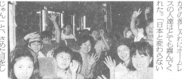
グランドキャニオンに向うバス