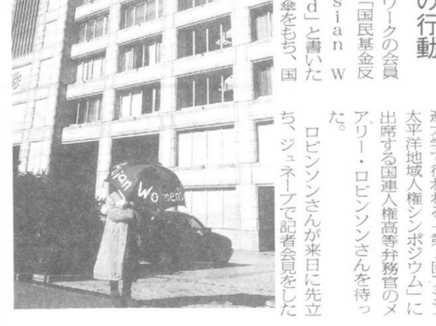
ロビンソンさんが来日し先立記者会見をした。