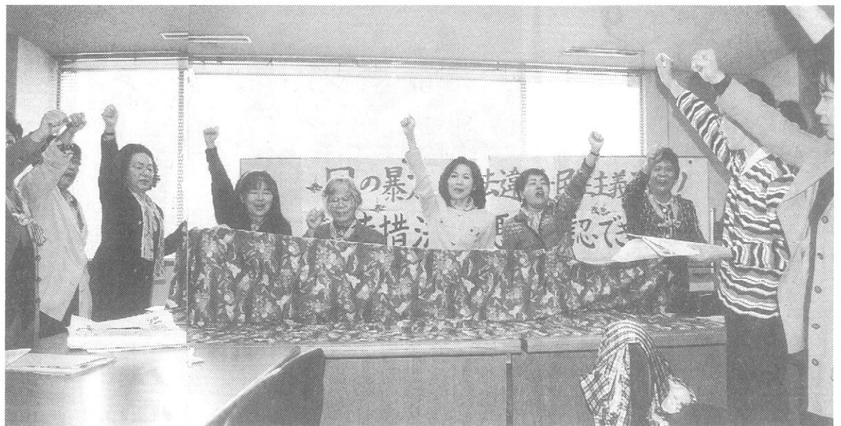
「ガンバろう」と力強い声を残して、沖縄の女性たちは各政党に向けて出発(衆議院第2会館で)

自民党から出された特措法改正案は、土地の所有権が切り離され、再集約が認められる。都道府県の意向を尊重する。この改正案は、沖縄の女性たちにとって、土地の所有権が切り離され、再集約が認められる。都道府県の意向を尊重する。この改正案は、沖縄の女性たちにとって、土地の所有権が切り離され、再集約が認められる。都道府県の意向を尊重する。