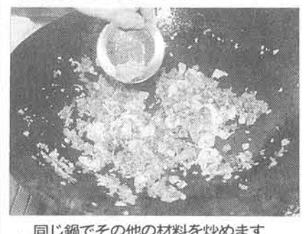
同じ鍋でその他の材料を炒めます