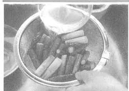
炒めたアスパラガスに、スープをかける

「出かけてみませんか」は、女性にとっての定番アイテム。しかし、近年は「パンツ」や「ショーツ」の着用が増えている。これは、女性の服装のトレンドが変化したことを示している。スカートは、女性にとっての定番アイテム。しかし、近年は「パンツ」や「ショーツ」の着用が増えている。これは、女性の服装のトレンドが変化したことを示している。