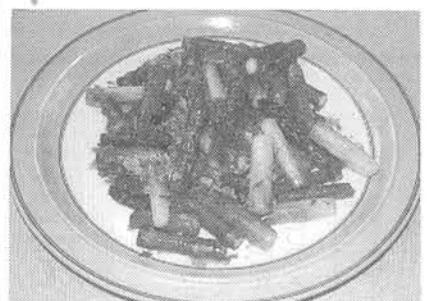
簡単で、しかもおかしになる一品

「グリーンアスパラ料理」は、女性にとっての定番アイテム。しかし、近年は「パンツ」や「ショーツ」の着用が増えている。これは、女性の服装のトレンドが変化したことを示している。スカートは、女性にとっての定番アイテム。しかし、近年は「パンツ」や「ショーツ」の着用が増えている。これは、女性の服装のトレンドが変化したことを示している。