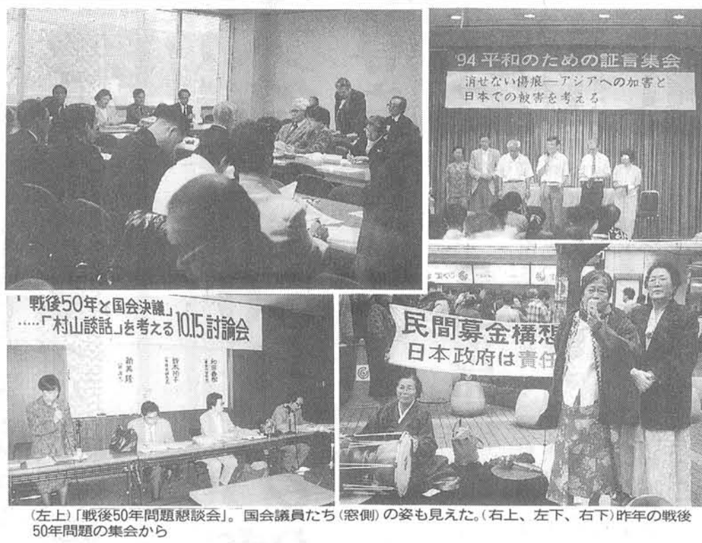
「戦後50年問題懇談会」。

「ムガル朝の収奪のシンボル」ムガル朝の収奪のシンボル。ムガル朝の収奪のシンボル。ムガル朝の収奪のシンボル。