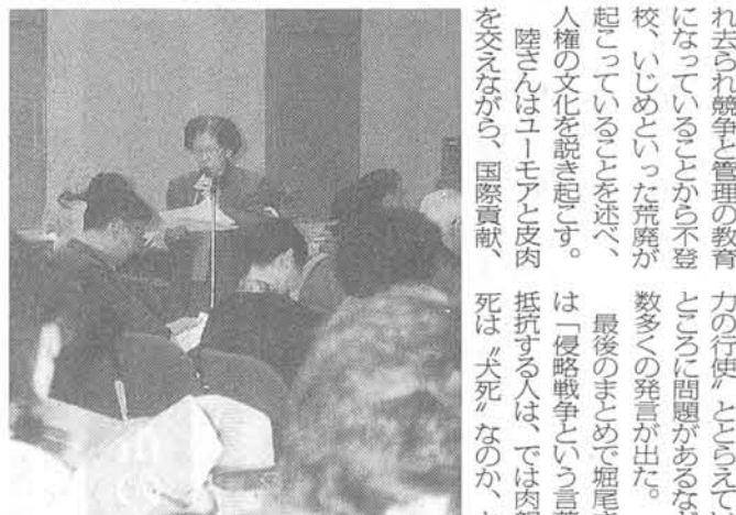
会場から発言が相ついだ