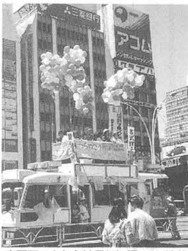
炎天下、女たちは元気に語った(渋谷)