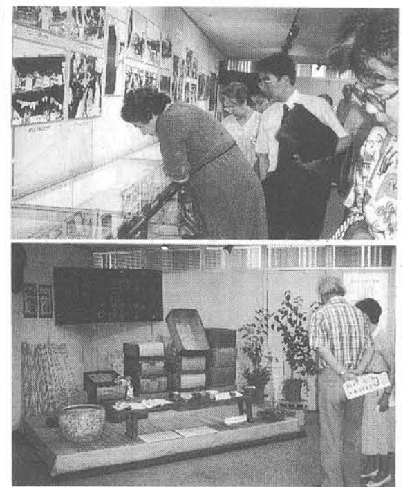
当時の日記にじっと見ている人々も多かった(上)。柳行李、火鉢、黒板...疎開時の日用品も展示された(下)。