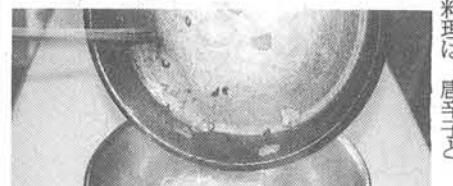
ゆで上がったスパゲッティと合えます