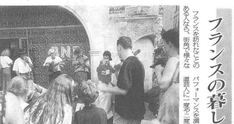
フランスを訪ねたパティシエさん