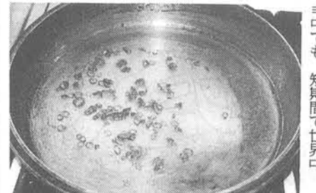
唐辛子の辛みを油に移します

「学童疎開の記録展」は、戦時中、疎開した子供達の生活や学業の状況を明らかにする。当時の日記や写真、手紙、食糧票、懐中電灯、黒板、火鉢など、当時の生活の様子を伝える。また、疎開先での生活の様子や、疎開後の生活の様子も展示されている。この展覧会は、戦時中の子供達の苦しい生活や、戦後の子供達の生活の改善などを考えるきっかけとなる。