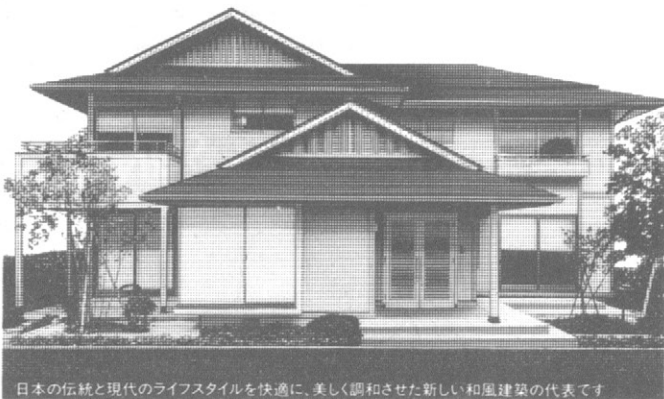
日本の伝統と現代のライフスタイルを快適に、美しく調和させた新しい和風建築の代表です