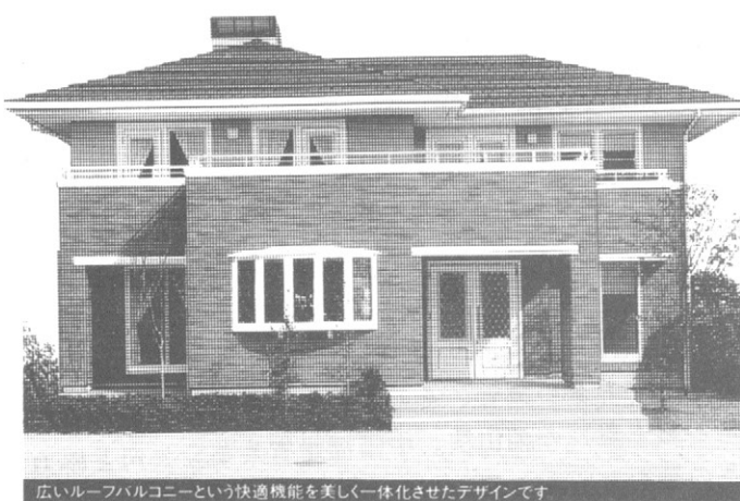
広いルーフトバルコニーという快適機能を楽しみ、一体化させたデザインです