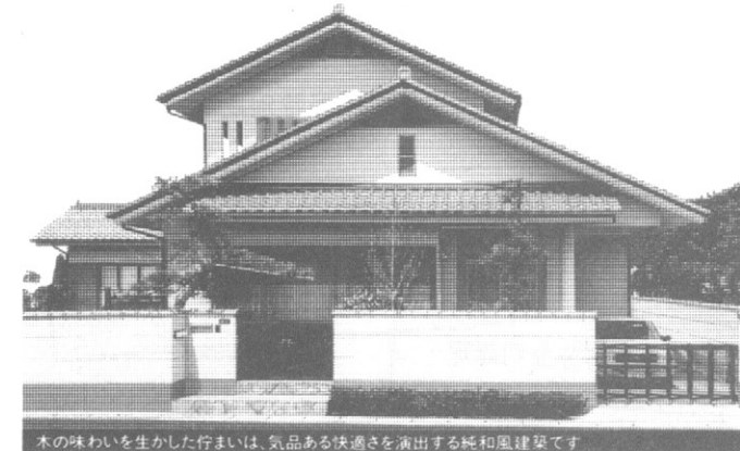
木の味わいを生かした住まいは、気品ある快適さを演出する純和風建築です