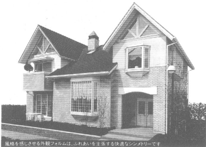
風格を感じさせる外観ファームは、ふれあいを主張する快適なシンメトリーです