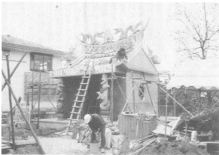
横浜市緑区みたけ台・長谷山祥泉院