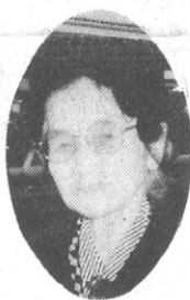
全国婦人新聞社社長