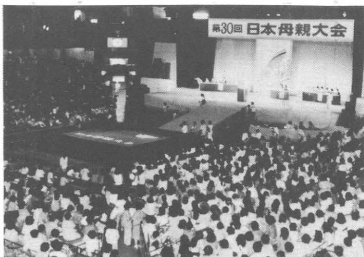
第1回のころ赤ちゃんも、いまお母さんに