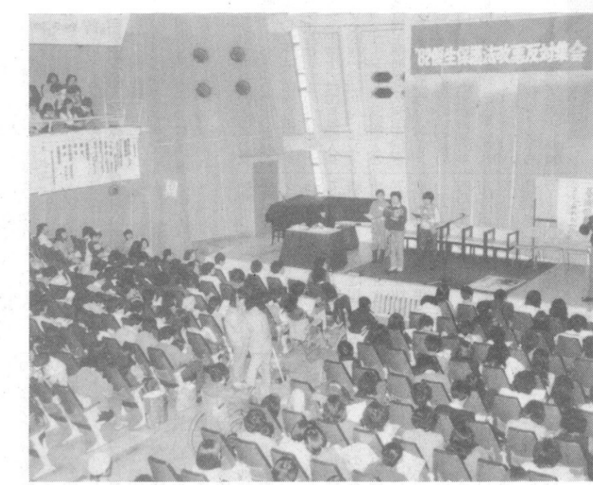
優生保護法改悪に反対し、1100人の参加者が会場を埋めつくした。