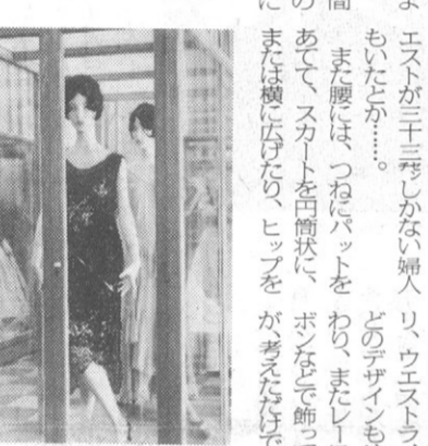
西洋服の歴史は、このギャルソンヌ・スタイル（1920年代）で終わる