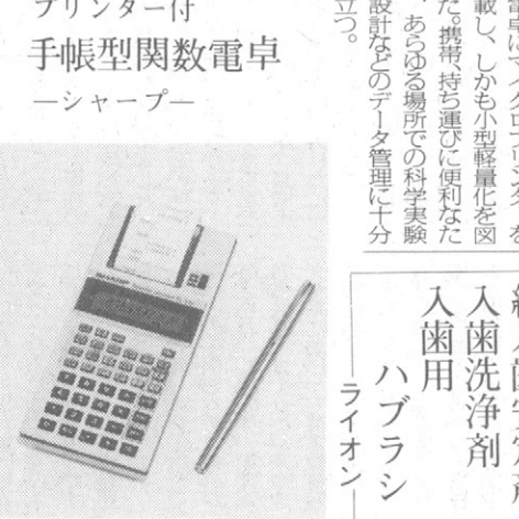
シャープ付手帳型関数電卓

シャープでは、携帯型関数電卓「シャープ」を開発しました。この電卓は、携帯型で、計算機能が高く、使いやすいため、学生やビジネスパーソンに人気があります。 シャープでは、携帯型関数電卓「シャープ」を開発しました。この電卓は、携帯型で、計算機能が高く、使いやすいため、学生やビジネスパーソンに人気があります。 シャープでは、携帯型関数電卓「シャープ」を開発しました。この電卓は、携帯型で、計算機能が高く、使いやすいため、学生やビジネスパーソンに人気があります。