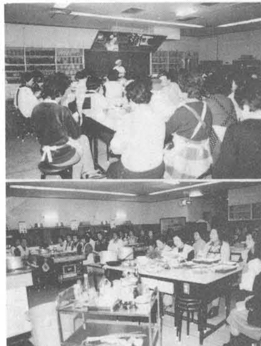
中は路大坂市台所情報担当米養士の説明を聞く会 員たち。熱心な受講風景

大阪府生活文化センターが主催する「料理・スポーツ」の活動が、今年度も盛況で進められている。この活動は、主婦の生活の豊かさを高め、健康増進を図ることを目的として、毎月1回、料理教室とスポーツ教室を交互に開催している。料理教室では、米養士が指導する「和食の基礎から学ぶ」コースと、プロのシェフが指導する「洋食の基礎から学ぶ」コースの2種類がある。スポーツ教室では、ヨガ、エアロビクス、水泳など、様々なプログラムが用意されている。参加者は、料理やスポーツを通じて、新しい友達を見つけ、交流を深めている。また、この活動を通じて、主婦の社会参加意識が高まり、地域社会への貢献意識も高まっているとされている。