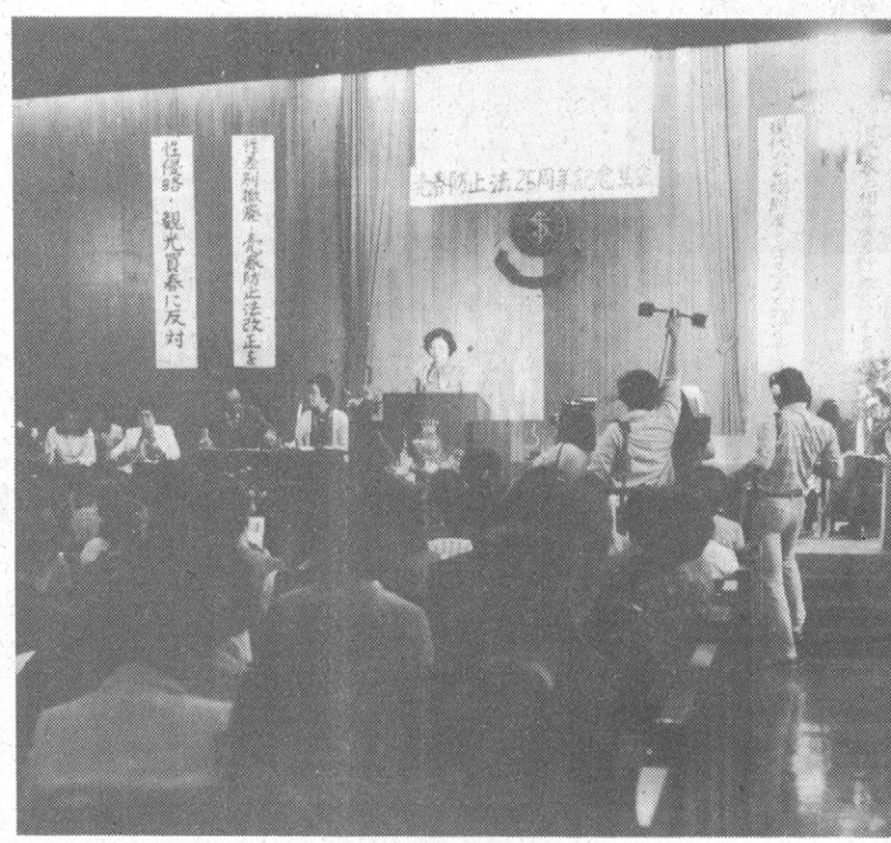
昭和二十一年の行革防正法。議員は、都道府県は議員が選出される。これにより、議員の任期が延長された。

昭和二十一年の行革防正法。議員は、都道府県は議員が選出される。これにより、議員の任期が延長された。この法律は、議員の任期を延長し、議員の数を削減することを目的として制定された。この法律は、議員の任期を延長し、議員の数を削減することを目的として制定された。