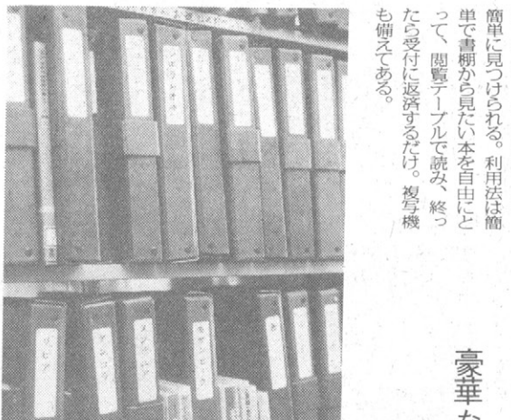
「ブックボックス」が別冊の目印になっている

「ブックボックス」が別冊の目印になっている。この別冊は、全国の婦人新聞社が協力して発行している。内容は、各地の文化・観光・芸術に関する情報が満載である。また、各地の婦人新聞社が協力して発行している。内容は、各地の文化・観光・芸術に関する情報が満載である。