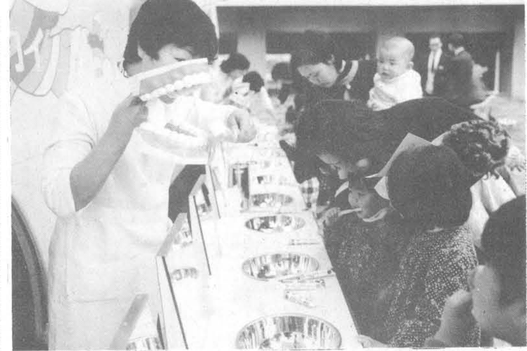
「歯の磨き方はこういふふう」ライオン歯科衛生士の団地サービス

「歯の磨き方はこういふふう」ライオン歯科衛生士の団地サービス。歯の健康は、生活の基盤。歯が健康でないと、生活の楽しみも半減する。ライオン歯科衛生士は、団地サービスを通じて、歯の健康を促進している。