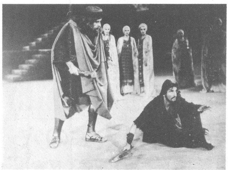
「フェニキアの女たち」—王位継承を争うオディプス王の息子たち