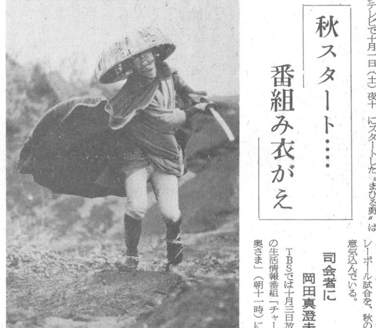
壮年・木枯し紋次郎さそう登場

「味の素・味の素」に人気 講演と料理の夏季大学 味の素は、フランスに焦点を 当てた講演と料理の夏季大学 を開催する。このイベントは、 味の素の魅力を伝えるための 重要な取り組みである。