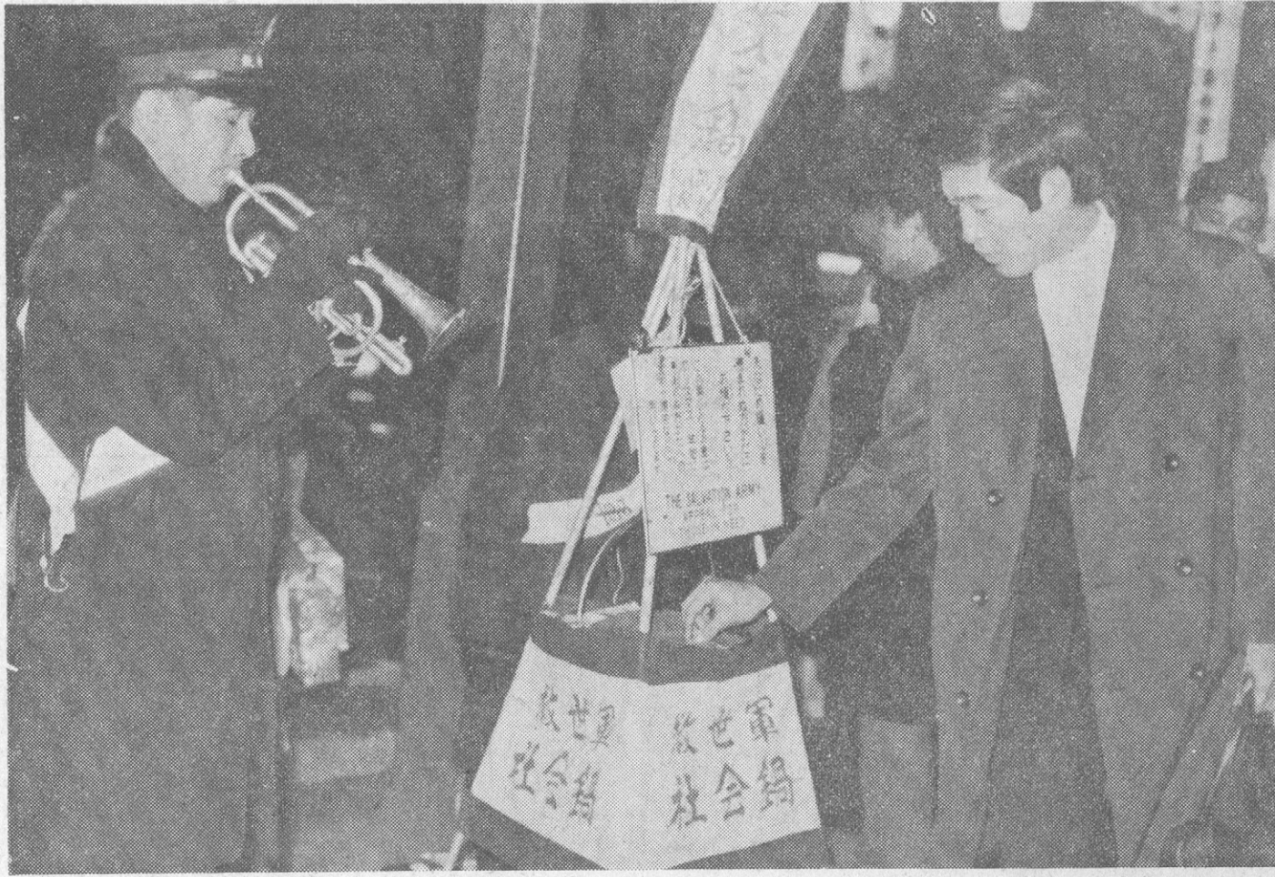
●●●師走の名物〈社会鍋〉●●●

五十二年十一月、昭和五十年年度厚生行政年次報告書(厚生省)が発表された。特筆すべきは、婦人と社会保障に関する諸問題について、四十四年間にわたって取り組んできた「婦人問題」の解決策として、この報告書の発表は、婦人と社会保障の分野に重要な役割を果たしている。この報告書は、婦人の地位や生活の改善、職種の確保と待遇改善、母子保健など重点に、意義深い諸問題への取り組みが示されている。