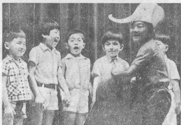
ラボパーティーの発表会での子どもたち

「子殺し」は、母が子を殺すこと。母が子を殺すことは、母の責任である。母が子を殺すことは、母の責任である。母が子を殺すことは、母の責任である。